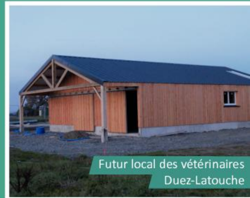
Futur local des vétérinaires Duez-Latouche

33 000 m 2 de parcelles modulables non viabilisées restent disponibles immédiatement à la vente, au prix de 5€ HT/m 2 .