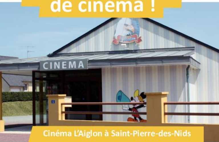
Cinéma L'Aiglon à Saint-Pierre-des-Nids